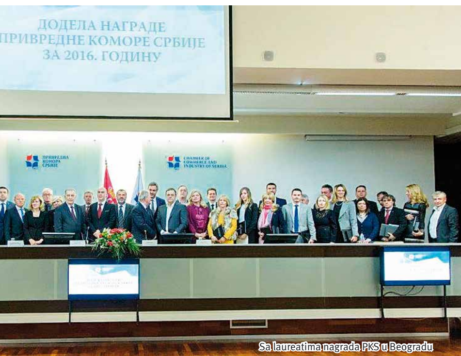
Sa laureatima nagrada PKS u Beogradu

Zato zaposlenima Društva i njihovim porodicama želim da im Nova 2017. godina po dobrome liči na godinu iza nas i da ih prati zdravlje, sreća i uspeh u svim životnim i radnim aktivnostima.