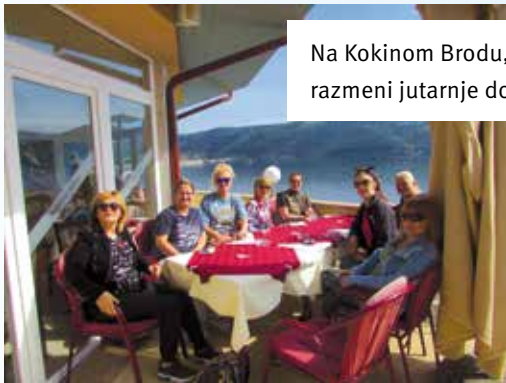
Na Kokinom Brodu, na kafi i razmeni jutarnje doze adrenalina