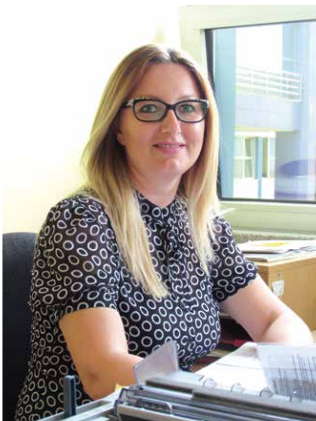
Danka Nikolić FINAL d.o.o.