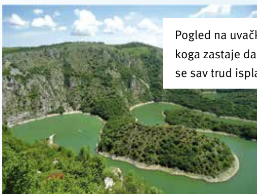
Pogled na uvačke meandre od koga zastaje dah i zbog koga se sav trud isplatio.