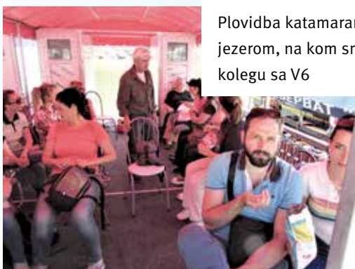
Plovidba katamaranom Uvačkim jezerom, na kom smo sreli i kolegu sa V6