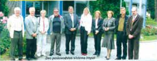
Dvo polugodišnja zarada Impol