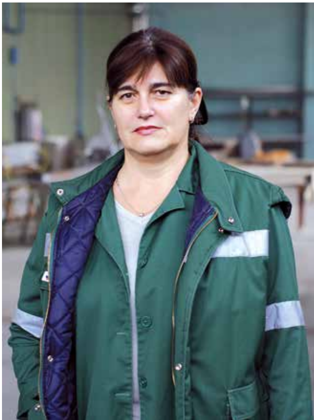
Pjević Milojka TEHNIKA d.o.o.