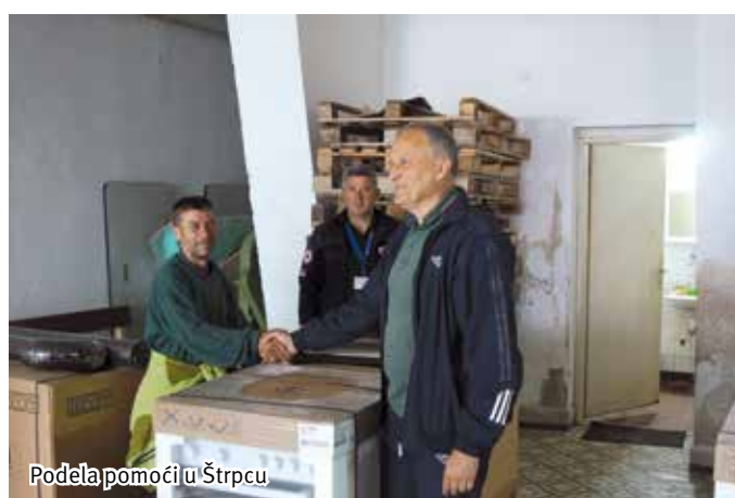
Podela pomoći u Štrpcu

Pored podele pomoći, tokom boravaka na jugu Kosova i Metohije, posjećene su i najveće srpske svetinje: Pečka Patrijaršija, Manastiri Draganac, Zočište, Devič, Gračanica, Sveti Arhangeli kod Prizrena i Visoki Dečani, kao i crkva Bogorodica Ljeviška i Crkva svetog Đorđa u Prizrenu, kao i sam stari grad Prizren i enklava Velika Hoča.