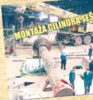
Livci Impol Sevala u Ko