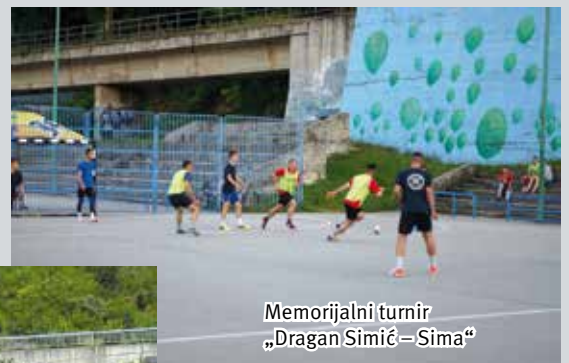
Memorijalni turnir „Dragan Simić – Sima“