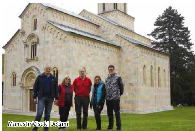
Manastir Visoki Dečani