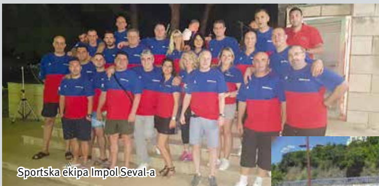
Sportska ekipa Impol Seval-a

U svim takmičenjima i na svim terenima zaposleni su takmičarskim duhom i sportskim ponašanjem u najboljem svetlu predstavljali Impol Seval.