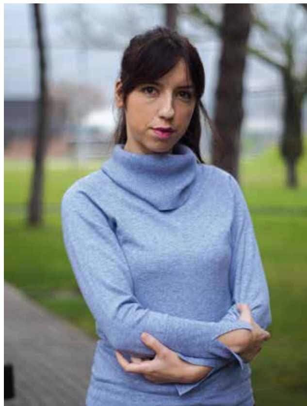
Milić Dragana FINAL d.o.o.

Treba što više da se zalažemo na razvoju timskog rada i kolegijalnosti.