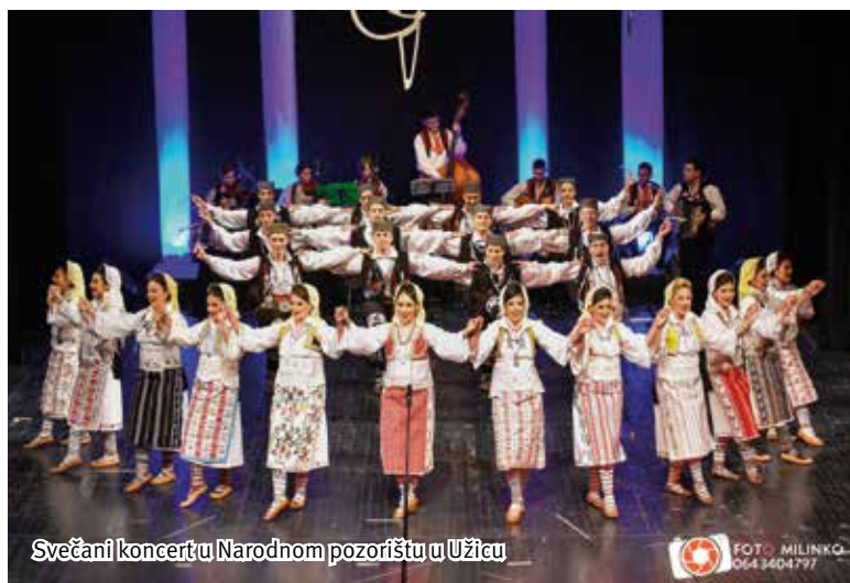
Svečani koncert u Narodnom pozorištu u Užicu

Novembar je tradicionalno rezervisan za svečani koncert ansambla i centralnu proslavu rođendana Društva, koja je, zbog renoviranja sale Narodnog pozorišta u Užicu, odložena za proleće iduće godine.