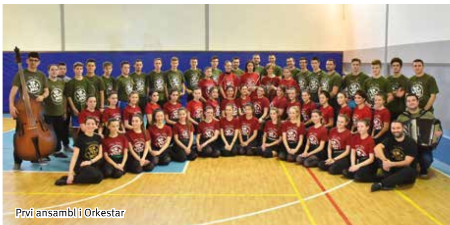
Prvi ansambl i Orkestar

Društvo je osnovano davne 1954. godine od strane radnika fabrike. Godinama su u Društvu postojale mnogobrojne sekcije. Folklorna sekcija se, uz narodni orkestar, vremenom izdvojila kao nosilac Društva i jedina opstala svih ovih 65 godina.