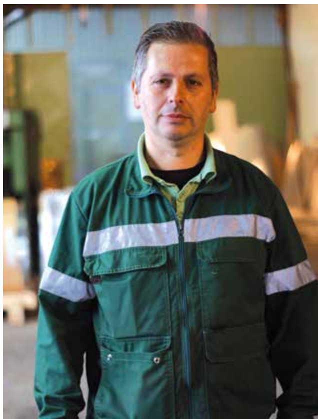
Tamburić Radomir TEHNIKA d.o.o.