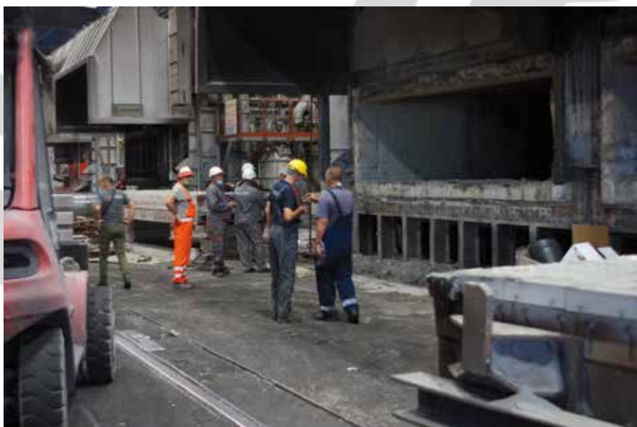
Peć za topljenje L1/4

Takođe, treba istaći i to da je za remont možda izabran najpogodniji momenat u godini. Trenutno u našem okruženju je došlo do smirivanja epidemiološke situacije nakon ozbiljnog talasa zaraze u junu i julu. Na ruku nam ide situacija da je došlo do značajnog pada broja zaraženih u gradu i regionu. Tokom avgusta meseca nije registrovan nijedan slučaj zaraze u Društvu, a u gradu Užicu poslednje nedelje avgusta nije bilo zaraženih. Na snazi su i dalje mere koje je propisala Vlada Republike Srbije. Može se očekivati da će epidemiološka situacija biti povoljna do kraja septembra, što nam daje mogućnost da remonte uspešno završimo. Međutim, ne sme doći do opuštanja u pogledu zaštite od širenja zarazne bolesti. Uslov za uspešan završetak remonta je dosledno poštovanje svih propisanih mera zaštite do samog kraja, bez izuzetaka.