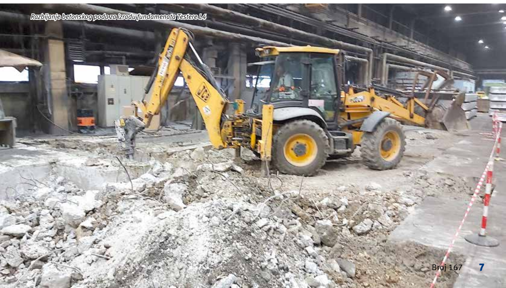
Razbijanje betonskog poda za izradu fundamenata Testere L4

Realizacijom ovog istorijskog projekta Impol Seval stvara preduslove za kvalitetnu i produktivnu proizvodnju u narednim godinama, ali i osnovu za budući investicioni razvoj – korak u budućnost.