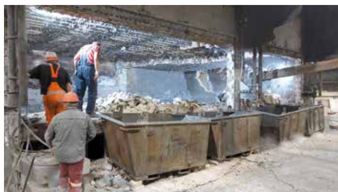
Rušenje ozida na peći za topljenje L1/4

Realizacija većeg broja drugih, manjih investicionih projekata je usporena ili odložena.