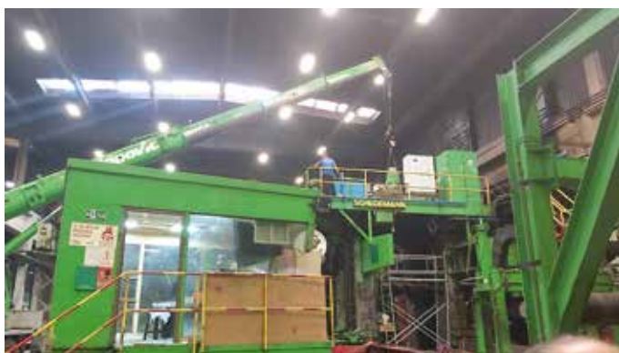
Montaža novog hidrauličnog cilindra za balansiranje jarma

Zato je manje rizična odluka, a to je da dan D za start realizacije ovog integralnog projekta bude 17. avgust 2020. godine.