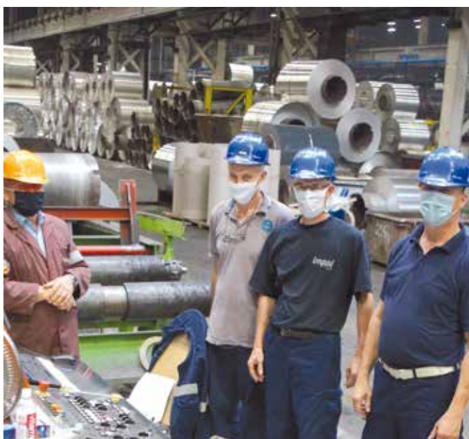
Obuka u PJ Valjaonica

Uputstvima su definisane obaveze zaposlenih u vezi sa sprečavanjem pojave i širenja epidemije zarazne bolesti, pa i aktuelne, COVID-19.