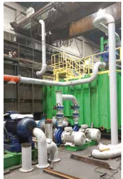
Montaža opreme na emulzionom postrojenju

Posloводство Društva i Projektni timovi, uz koordinaciju sa Upravom kompanije IMPOL, donelo je veoma hrabru i rizičnu odluku, a to je da se realizacija sva tri navedena projekta sprovede istovremeno. Rizik istovremene realizacije proističe iz toga što je paralelno angažovan veliki broj bravara, hidrauličara, električara, kao i radnika drugih specijalnosti.