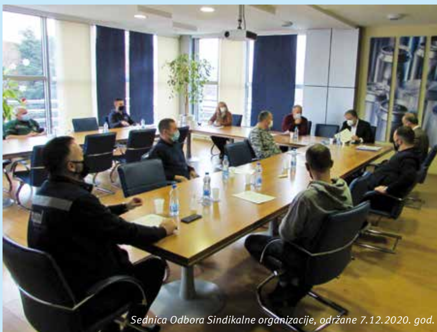
Sednica Odbora Sindikalne organizacije, održane 7.12.2020. god.

Svim zaposlenim i poslovodstvu Društva, želim srećne novogodišnje i božićne praznike!