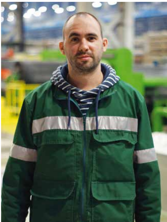
Vjetrović Vuk Tehnika d.o.o.

Obrazovanje: Izvođač osnovnih građevinskih radova