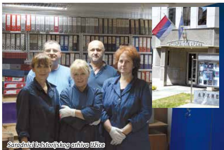
Saradnici iz Istorijskog arhiva Užice

1. Pravilnik o načinu evidentiranja, klasifikovanja, arhiviranja i čuvanja arhivske građe i dokumentarnog materijala, kao i