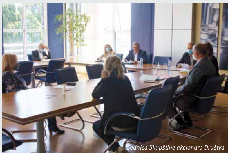
Sednica Skupštine akcionara Društva