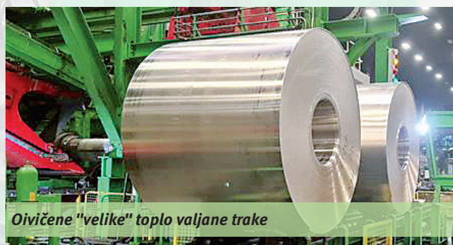
Ovičene "velike" toplo valjane trake