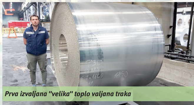
Prva izvaljana "velika" toplo valjana traka

Valjanje je proteklo bez većih problema.