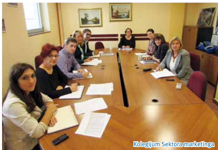
Kolegijum Sektora marketinga

Dobar komercijalista se stvara u Društvu. I pored velike ponude radne snage na tržištu gotovo je nemoguće eksterno dobiti komercijalistu, adekvatnog potrebama Društva. Komercijalista pored specifičnih tehničkih, ekonomskih i drugih znanja mora da poseduje posebne veštine i bude orjentisan na timski rad. Sposobnost odlučivanja i sposobnost uočavanja mogućnosti i reagovanja na prilike su uslov da zaposleni uz temeljan mentorski rad, u periodu do dve godine stekne neophodnu samostalnost za obavljanje poslova i bude spreman za preuzimanje pune odgovornosti za svoj doprinos postizanju zadatih ciljeva.