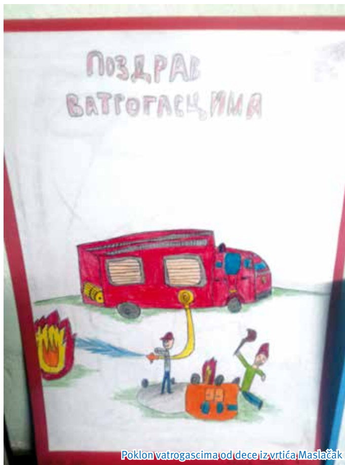
Poklon vatrogascima od dece iz vrtića Maslačak