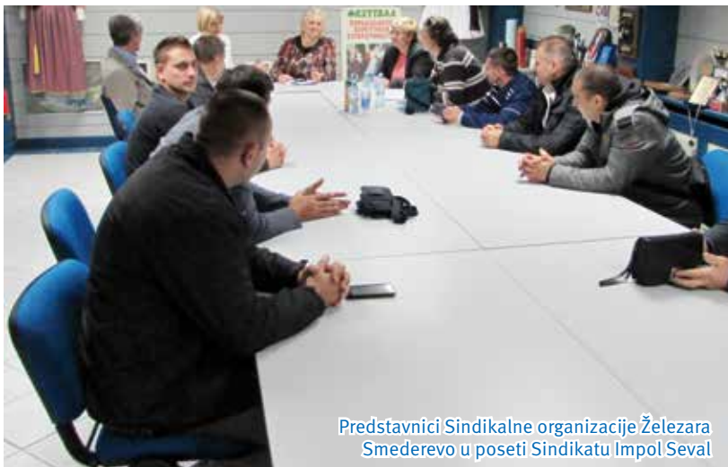
Predstavnici Sindikalne organizacije Železara Smederevo u poseti Sindikatu Impol Seval

Posebno značajne aktivnosti Sindikata u ovom periodu, su one koje se odnose na zaključenje Aneksa Kolektivnog ugovora sa Poslodavcem 21.09.2015. godine, kojim je, za slučaj nastanka osnova, definisana mogućnost i uslovi za utvrđivanje viška zaposlenih i uvećanje zarade za noćni rad sa dosadašnjih 40 % na 50 %.