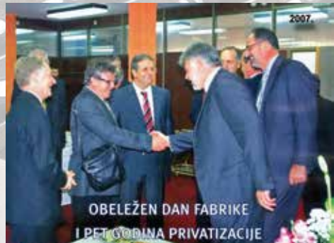
OBELEŽEN DAN FABRIKE I PET GODINA PRIVATIZACIJE