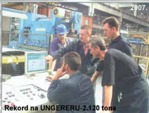
Rekord na UNGERERU-2.120 tona