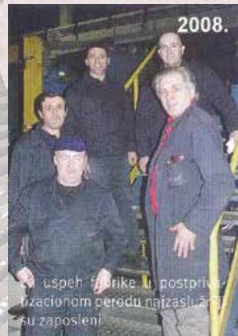
uspeh fabrike u postprizivacionom periodu najzaslužniji su zaposleni