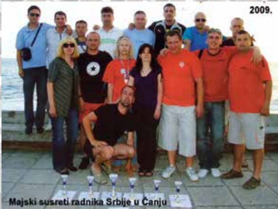
Majski susreti radnika Srbije u Canju