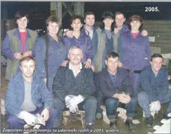
Zaposleni na pakovanju su udarnički radili u 2005. godini