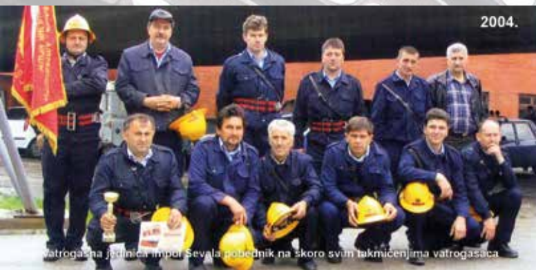
Vatrogasna jedinica Impol Sevala pobednik na skoro svim takmicenjima vatrogasaca